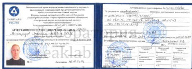
Формы документов об аттестации по требованиям Ростехнадзор и Росатом ГОСТ Р 50.05.11