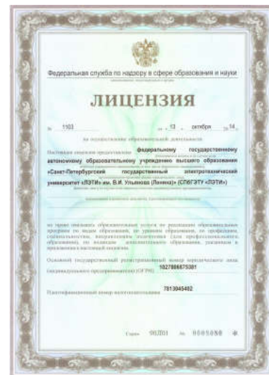
Курс проводится по лицензии на образовательную деятельность

Контроль герметичности имеет особое значение для обеспечения качества и безопасности продукции. Недостаточная герметичность может привести к утечке газов, жидкостей или паров, что может вызвать сбои в работе оборудования или опасные ситуации для персонала. Поэтому владение методами и техниками контроля герметичности является необходимым навыком для специалистов, работающих с вакуумными системами.