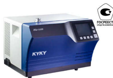
Изучение течеискателя ZQJ-Vactron из ГОСРЕЕСТРА СИ РФ

Подготовка к аттестации по методу «контроль герметичности»